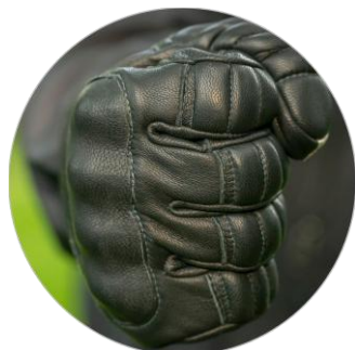
Silná a robustní konstrukce rukavic