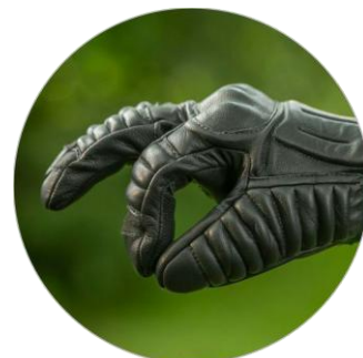
Anatomický a pohodlný střih rukavic