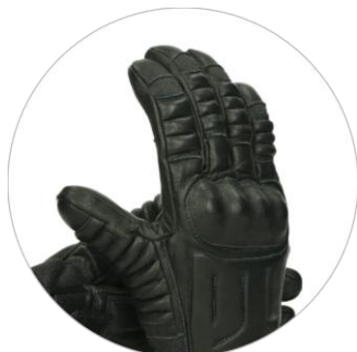
D3O® chránič kloubů na hřbetu ruky