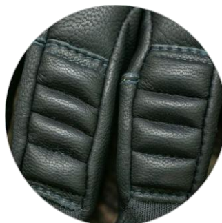
Výztuha z koží kůže s PORON® XRD™ absorbujícím nárazy