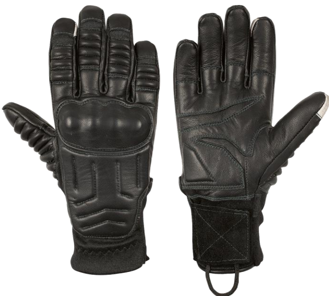
CORA Long Black